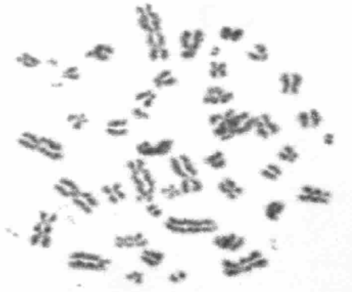
Abbildung 2: Multiaberrante Zelle

Dosis von 1 Sievert (Sv) ausgesetzt wurden, im Mittel 5 dadurch zusätzlich an Krebs sterben werden. Oder anders ausgedrückt: Eine mit der Dosis 1 Sv bestrahlte Person hat dadurch im Mittel ein zusätzliches Risiko von 5 Prozent, an Krebs zu sterben. Die benutzte Doseinheit Sv (Sievert) soll alle Bestrahlungsarten vergleichbar machen und heißt deshalb „Äquivalentdosis“.